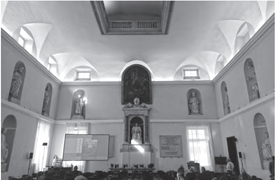
Genova, Palazzo di San Giorgio, Sala delle Compere