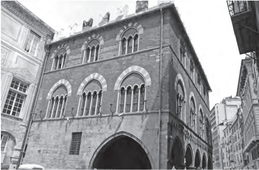
Genova, Palazzo di San Giorgio, Esterno di Levante