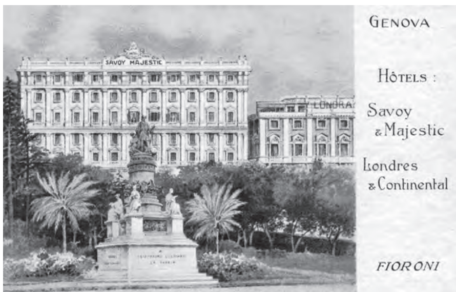
Figura 2. Il Grand Hotel Savoia Majestic di Genova, che accoglie la delegazione francese