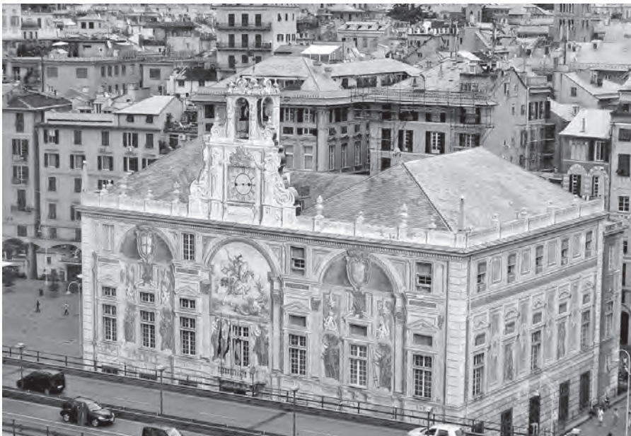
Genova, Palazzo di San Giorgio, Esterno di Ponente