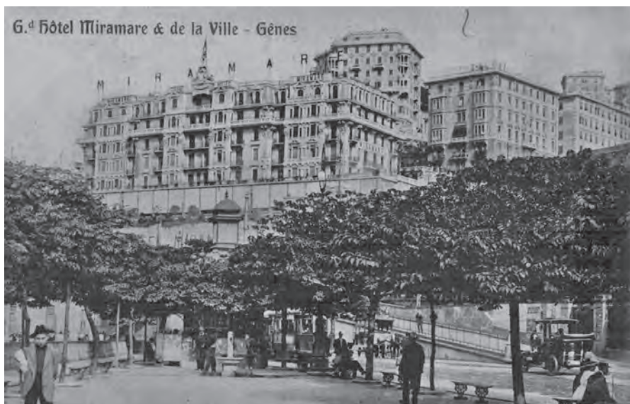
Figura 1. Il Grand Hotel Miramare et de la Ville di Genova, che ospita le rappresentanze di Belgio, Impero britannico e Svizzera