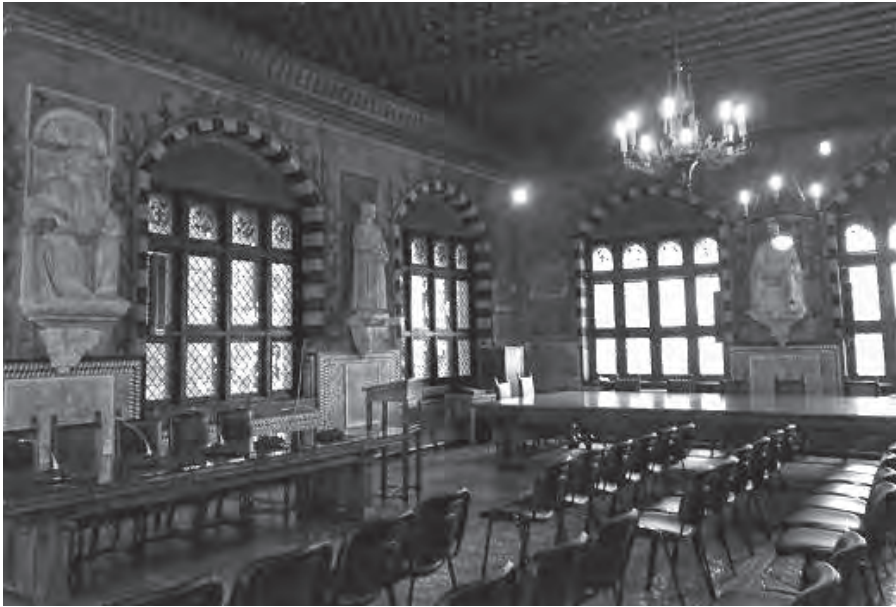
Genova, Palazzo di San Giorgio, Sala del Capitano del Popolo