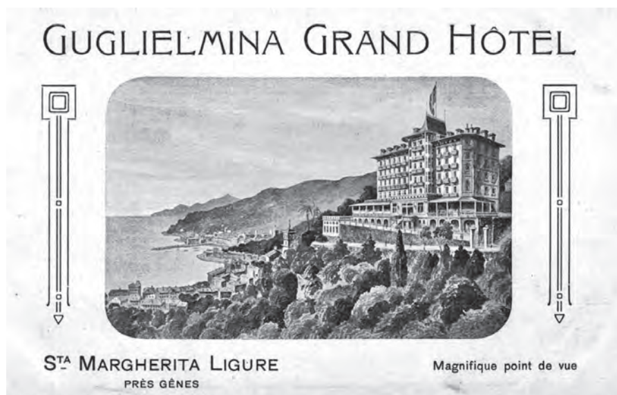
Figura 3. L'Hotel Guglielmina di Santa Margherita, sede della delegazione iugoslava