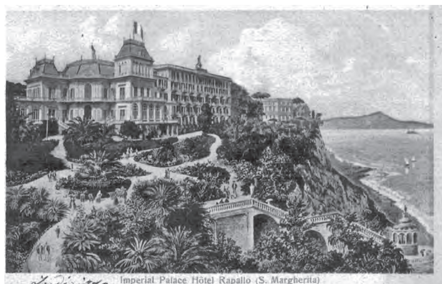
Figura 4. L'Imperial Palace Hotel di Rapallo, in cui alloggia la delegazione russa