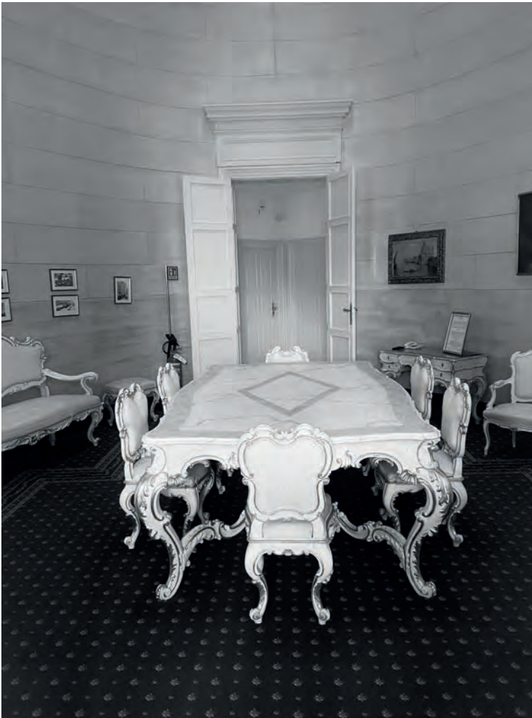
L'Hotel Imperiale di Santa Margherita

[...] La delegazione sovietica è sempre circondata da un alone di mistero. Questo è dovuto ai metodi adottati dalla Polizia segreta italiana [...] I sovietici avevano preteso dal Governo italiano garanzie molto rigide prima di acconsentire di venire a Genova [...] Dopo averli sistemati all'Hotel Imperiale a Santa Margherita Ligure avevano piazzato tanti militari intorno all'albergo che non sarebbe entrato neanche un topo. Di più, all'entrata un Commissario della Polizia segreta era a tal punto inflessibile e pignolo che neppure San Pietro avrebbe potuto accedere ai giardini celesti facendogli capire che non aveva alcun diritto al paradiso e che sarebbe stato fortunato se non lo arrestava.